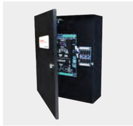
CA450 av. NET6P-KHS