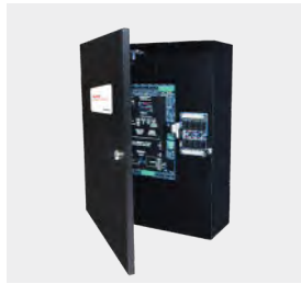
CA250 av. NET6P-KHS