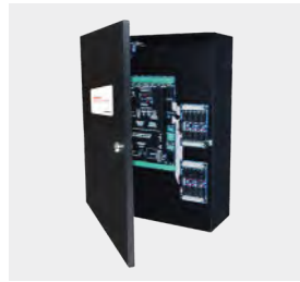
CA850 av. NET6P-KHS